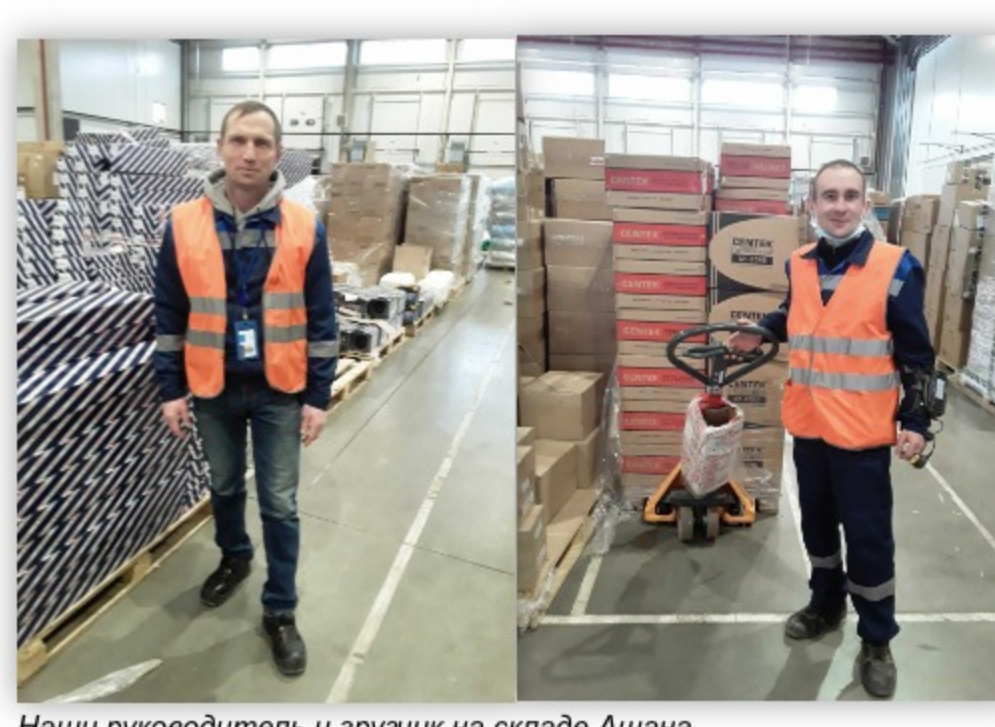
Наши руководитель и грузчик на складе Ашана