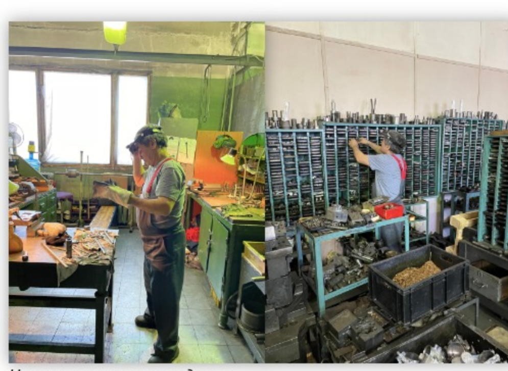
Наш мастер на производстве